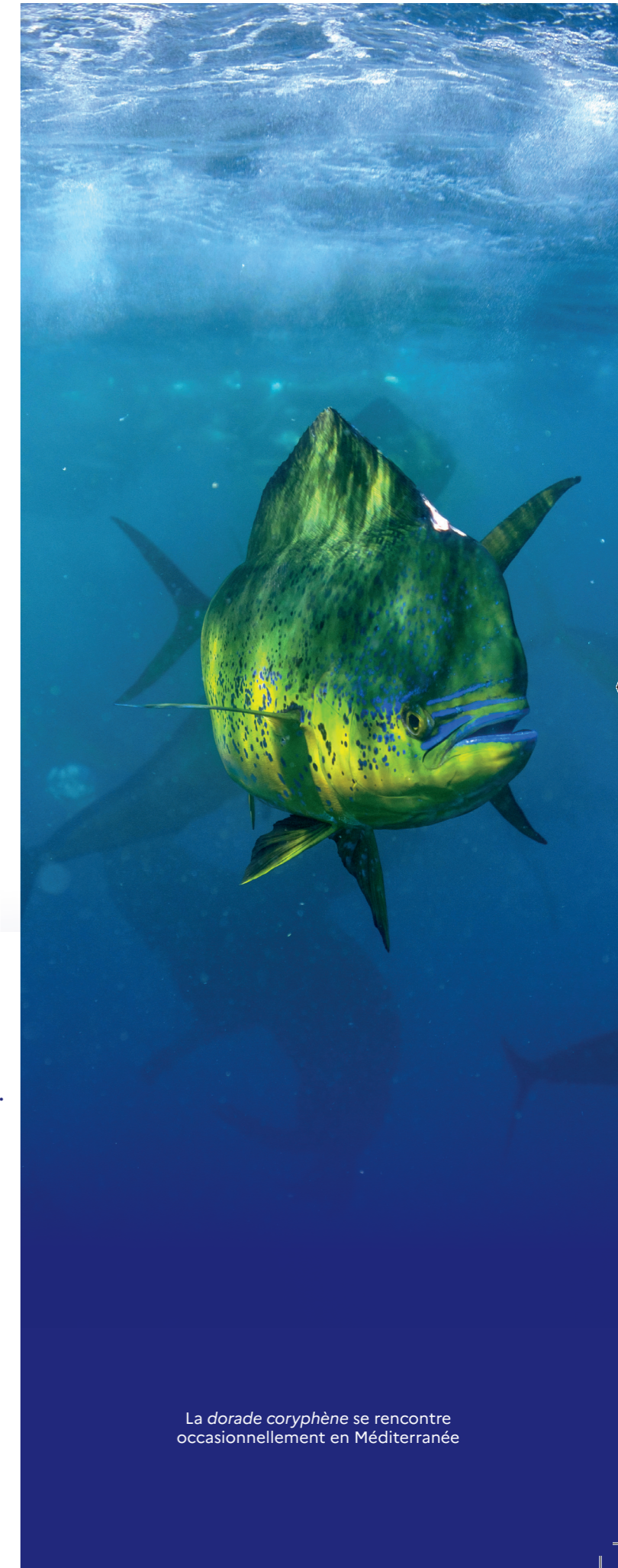
La dorade coryphène se rencontre occasionnellement en Méditerranée

Les données collectées respectent la réglementation sur la protection des données personnelles et ne seront pas utilisées à des fins commerciales. Elles sont uniquement utilisées à des fins de connaissance scientifique, conformément à l'article 55 du règlement (UE) 2023/2842 sur le contrôle des pêches.